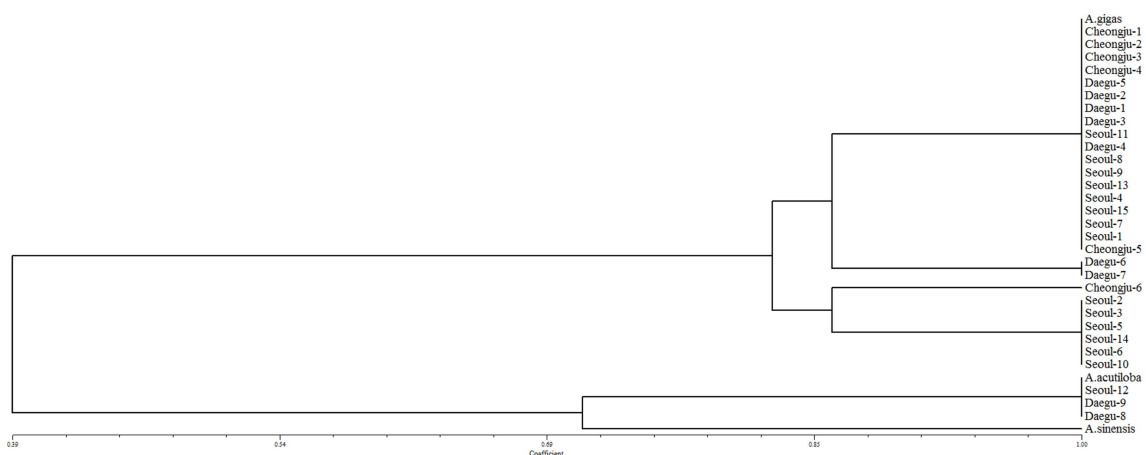
Fig. 2. Phylogenetic analysis of 33 Angelica samples using the genotyping results generated by 2 cpSSR markers. Phylogenetic tree was generated by NTSYS-pc 2.11 program (Exeter Software, Setauket, NY, USA) using UPGMA algorithm and sequential hierarchical agglomerative non-overlapping (SHAN) clustering.

Genotyping을 통하여 얻어진 데이터를 기반으로 33 개의 샘플을 이용하여 계통학적 분석을 실시한 결과 참당귀는 일부 다형성을 보인 것으로 인하여 4 개의 cluster로 나누어지는 것을