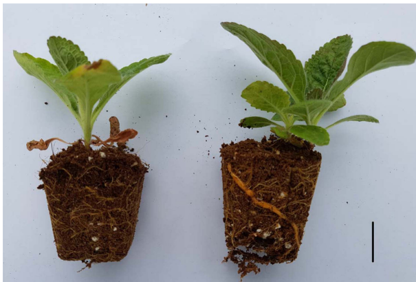
Fig. 2. Mat formation of different seedling periods in R. glutinosa (left; 30 days, right; 45 days). The bar size is 2 cm.

Means values ± SD from triplicate separated experiments are shown. *Means with difference letters are significantly different at p < 0.05 by Duncan's Multiple Range Test (DMRT). DS1, DS2 indicates directly seeding, directly seeding (replanting), respectively.